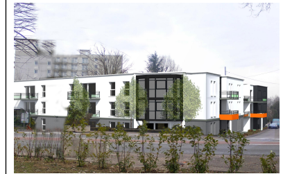
Rue des trois Marronniers